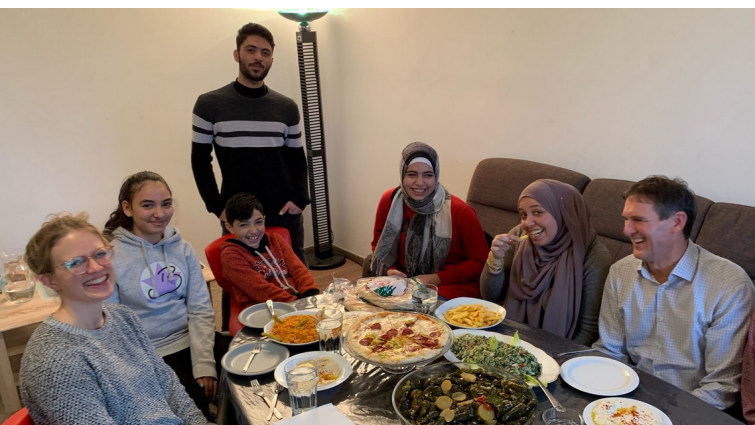
Eingeladen bei der Patenschaft

"Die junge Irakerin ist super zufrieden und die Patin hat ihr bei der Prüfung wirklich noch sehr geholfen. Sie hat eine super zwei geschrieben und ist sehr stolz. Die beiden möchten gerne weitermachen und die junge Frau hat ein neues Ziel, die C1-Prüfung sowie Unterstützung bei der Berufsschule. Sie fängt im Herbst bei der Fachakademie für Sozialpädagogik an. Habe mit der Patin gesprochen, und sie klang auch sehr zufrieden mit ihrer Aufgabe. Deshalb würde es uns sehr freuen, wenn es weiterlaufen könnte."