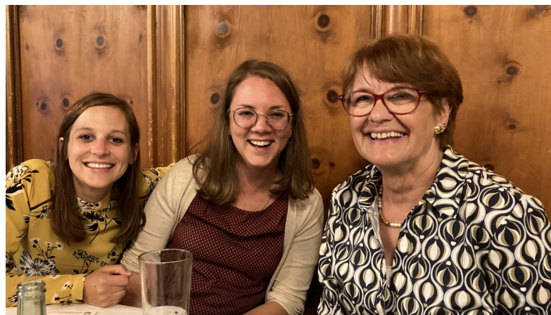
Patinnen von BiP

Wir freuen uns auf das Training und sind schon sehr gespannt auf die Ergebnisse.